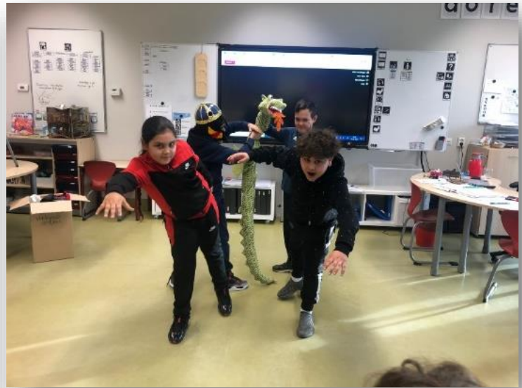
IPC geschiedenis, de legende van Joris en de Draak